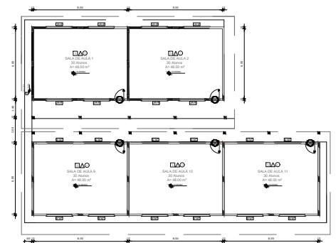
02 DETALHAMENTO - SALAS ACRÉSCIMO ESCOLA MUNICIPAL IANA MONTEIRO